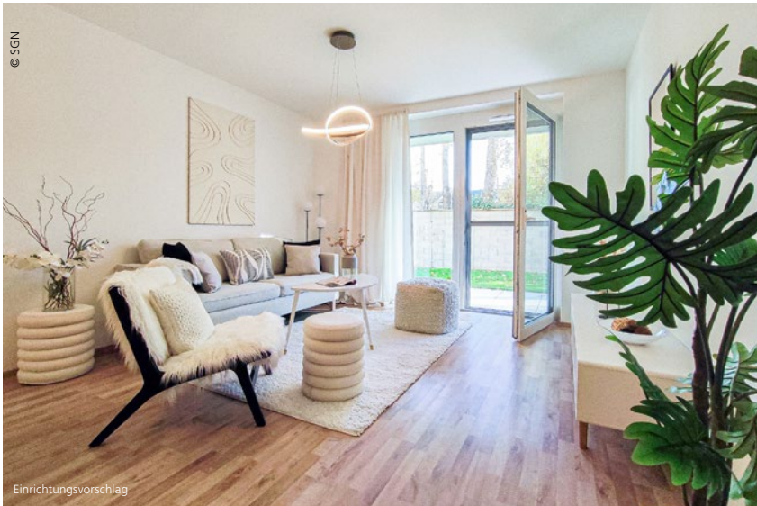
GO 2 EISENSTADT 4 LIVING: Die Wohnungen der modernen Wohnhausanlage der SGN in Eisenstadt überzeugen in vielerlei Hinsicht.

Bei Tagen der offenen Tür konnten sich Interessierte kürzlich von den Vorzügen der neuen Wohnhausanlage GO 2 EISENSTADT 4 LIVING der SGN überzeugen. Und die Möglichkeit, sich einen persönlichen Eindruck von diesen wunderschönen Wohnungen zu verschaffen, wurde ausgiebig genutzt.