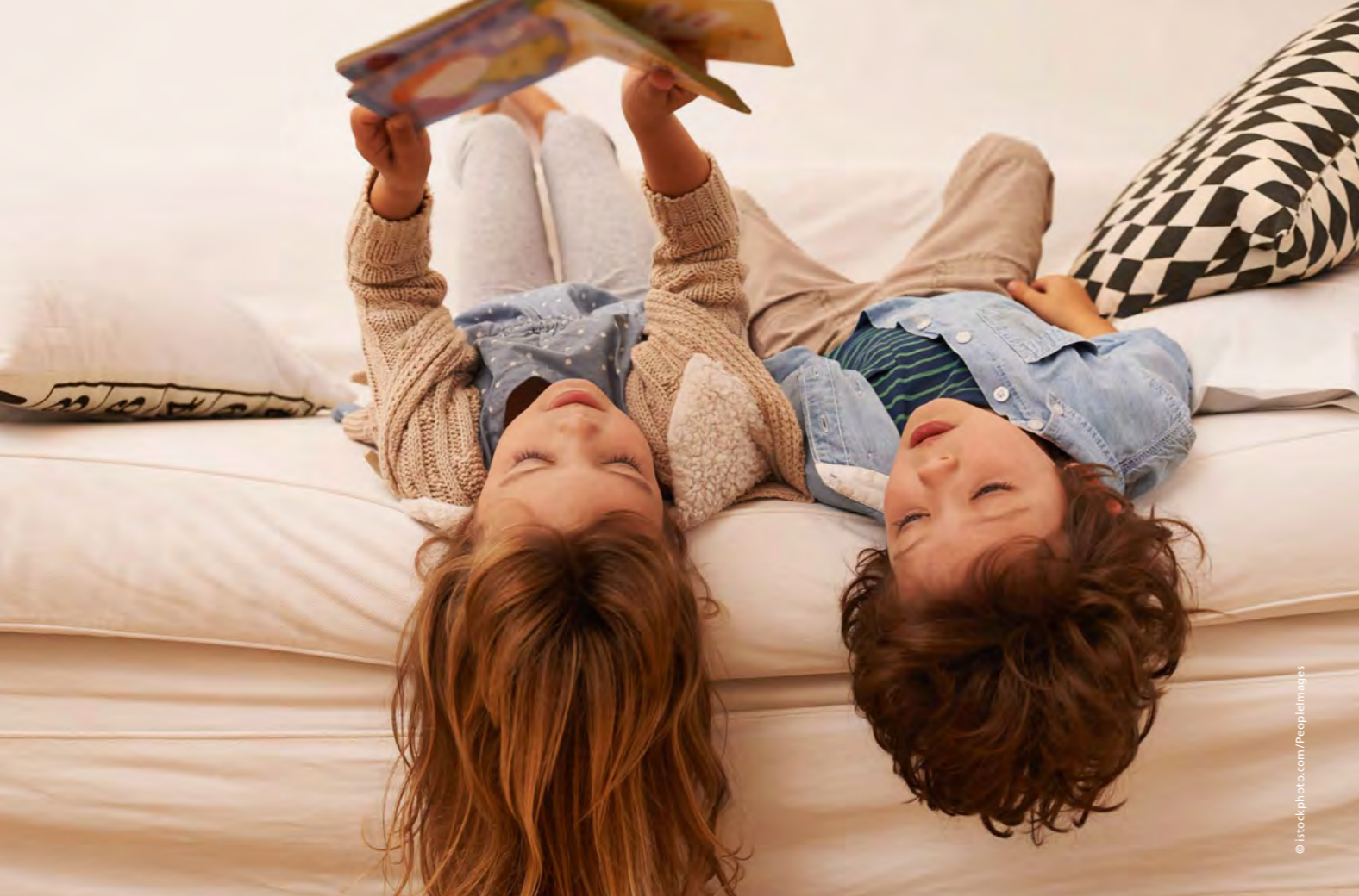
Mit einem leichten Pullover kann es auch bei etwas weniger Graden ausgesprochen gemütlich sein.